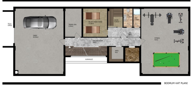
BOYUTUM KAT PLANI