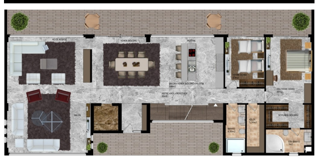
B-D-BLOK ZEMİN KAT PLANI