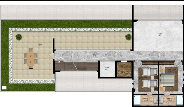
C-BLOK 1.KAT PLANI