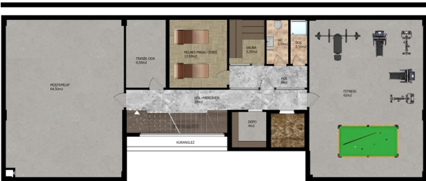
C-BLOK BODRUM KAT PLANI