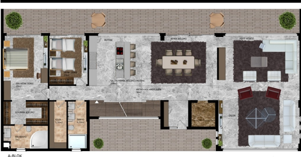
A-BLOK ZEMİN KAT PLANI