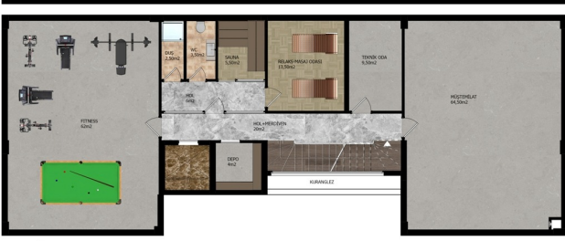
B-D-BLOK BODRUM KAT PLANI