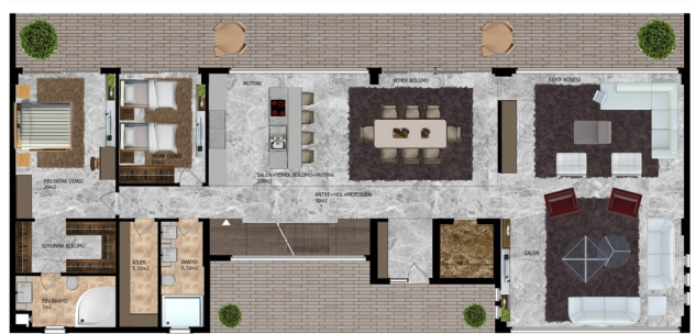
C-BLOK ZEMİN KAT PLANI