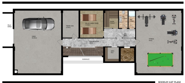
BOORUM KAT PLANI