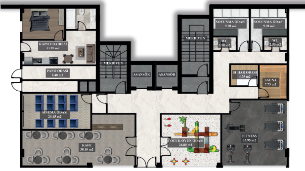
TERS DUBLEKS ÜST KAT PLANI