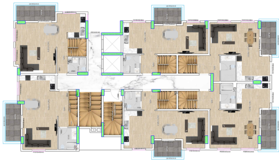
DUBLEX ALT KAT PLANI