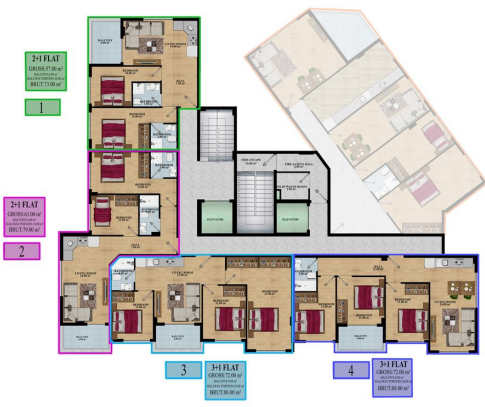
-1 BASEMENT FLOOR PLAN