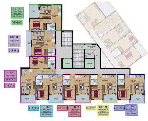
GROUND-1-2-3 FLOOR PLAN