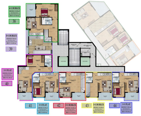
4 FLOOR PLAN