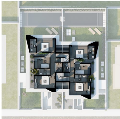
1st. Floor 73,50 m 2