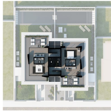
2nd. Floor 35,00 m 2