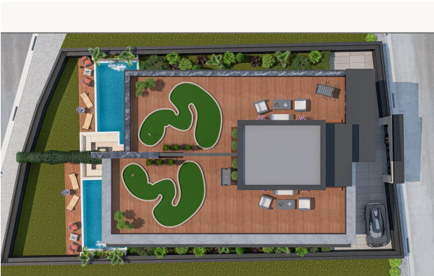
FLOOR 2 2.ЭТАЖ ETAGE 2