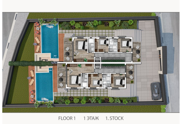
FLOOR 1 1.ЭТАЖ 1.СТОК