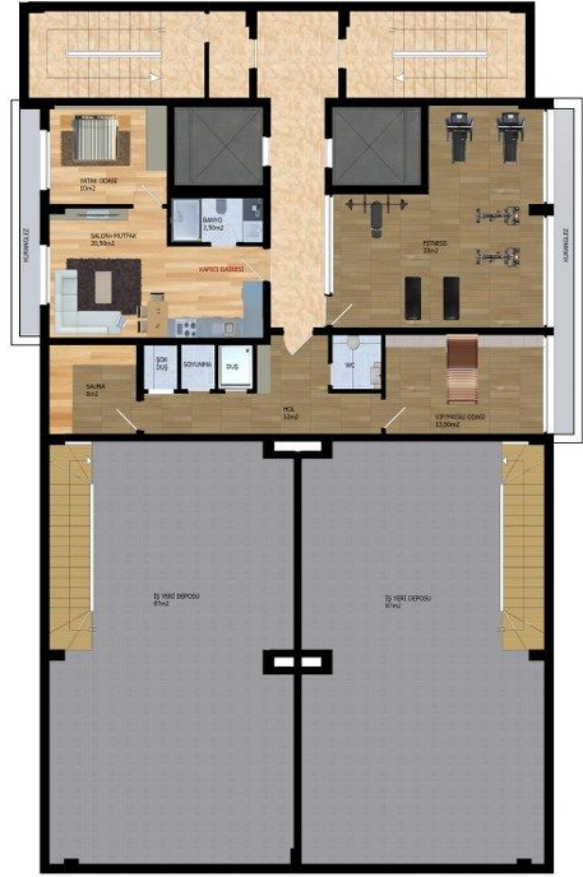
ZEMİN KAT PLANI