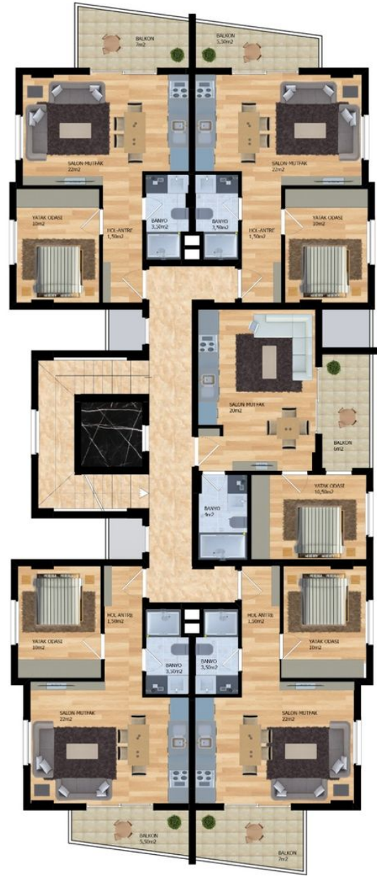
ZEMİN KAT PLANI