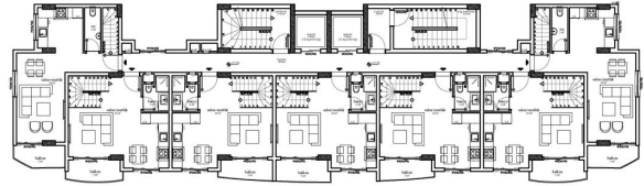
11. KAT PLANI