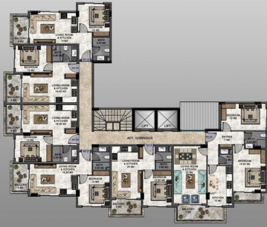
4. FLOOR PLAN