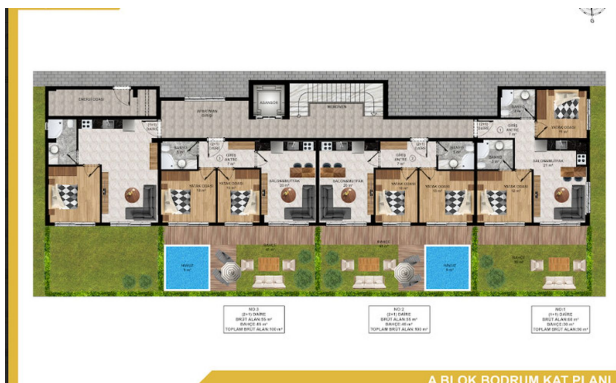
A BLOK BODRUM KAT PLANI