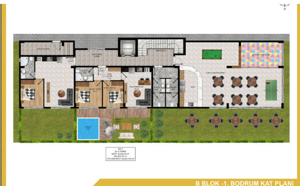
B BLOK -1. BODRUM KAT PLANI