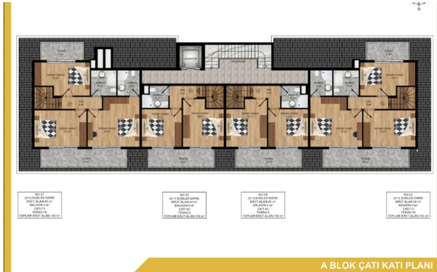
A BLOK ÇATI KATI PLANI