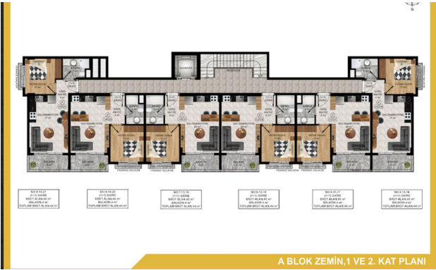
A BLOK ZEMİN, 1 VE 2. KAT PLANI