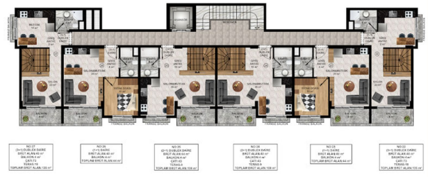
A BLOK 3. KAT PLANI