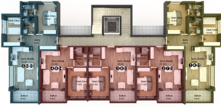
1192 ADA 4 PARSEL 1.2 BLOK ZEMİN 1-2.KAT