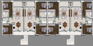
ТІР С [2+1 - 3+1 АРТ DOUBLE BLOCKS]