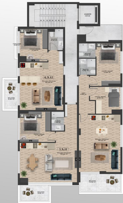
1./2./3. KAT PLANI