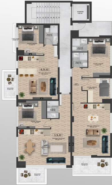
1./2./3. KAT PLANI