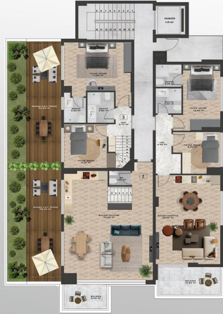
1. BODRUM KAT PLANI