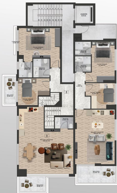
ZEMIN KAT PLANI