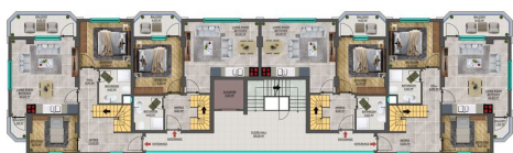
DUBLEX FLOOR PLAN