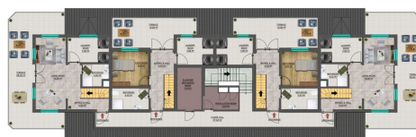
ROOF FLOOR PLAN