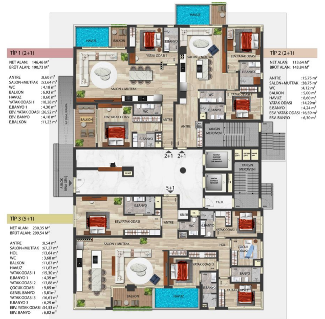
A BLOK ZEMİN KAT PLANI