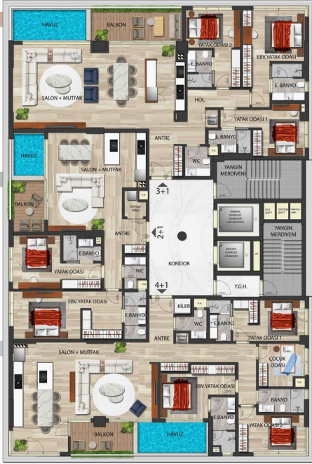
A BLOK 1., 2., 3., 4., 5., 6., 7., 8., 9., 10., 11., 12., ve 13. KAT PLANI