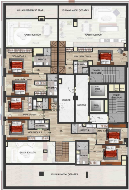
A BLOK ÇATI KATI PLANI (DUBLEX ÜST KAT)