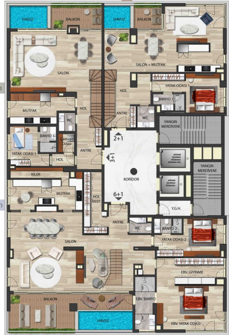
A BLOK 14. KAT PLANI (DUBLEX ALT KAT)