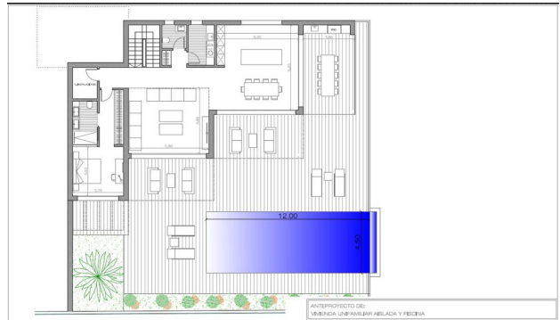
ANTEPROYECTO DE: VIVIENDA UNIFAMILIAR AISLADA Y RECINTA