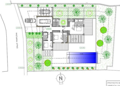
PROYECTO BÁSICO DE: VIVIENDA UNIFAMILIAR AISLADA Y RECINTA