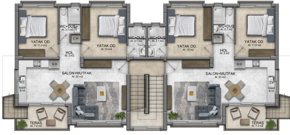
1. KAT PLANI A TIPI