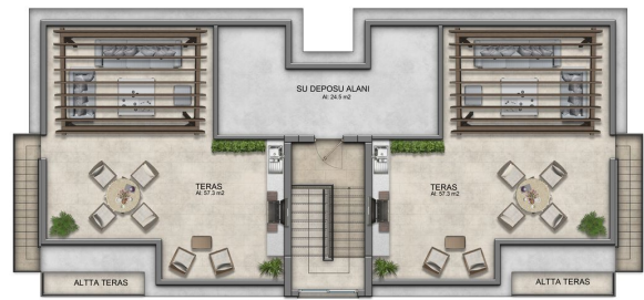
MERDIVEN KULESİ PLANI A TİPİ