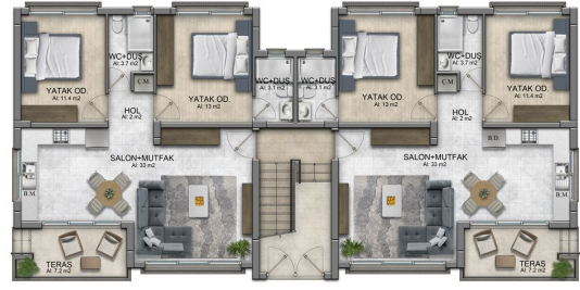
ZEMIN KAT PLANI A TIPI