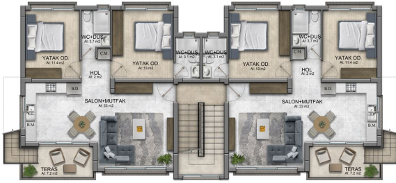
1. KAT PLANI A TİPİ