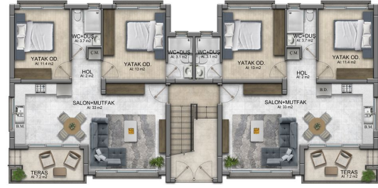
ZEMİN KAT PLANI A TIPI