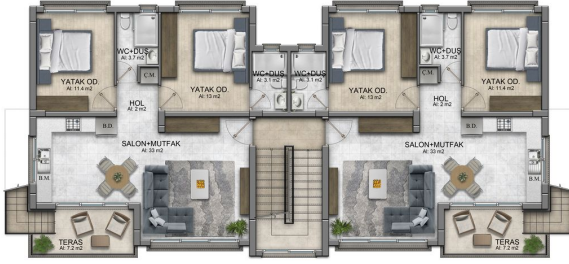
1. KAT PLANI A TIPI