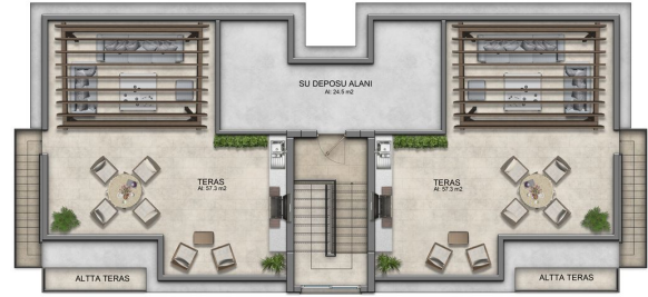
MERDİVEN KULESİ PLANI A TIPI