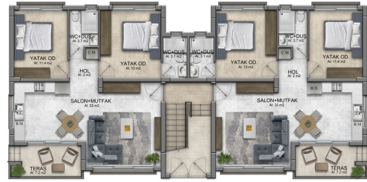
ZEMİN KAT PLANI A TİPİ