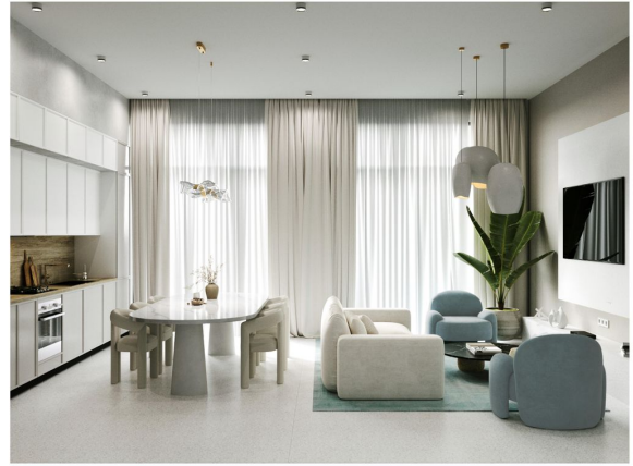
Kitchen & Living Area of Villa 3 Bedrooms