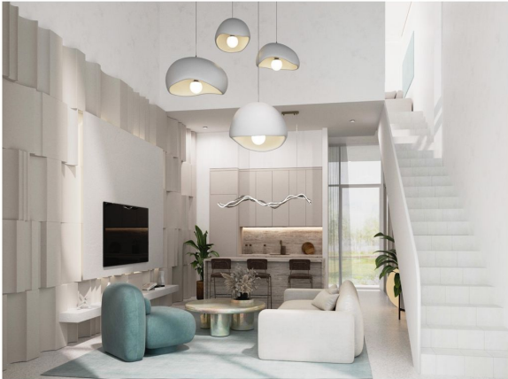
Kitchen & Living Area of Town House