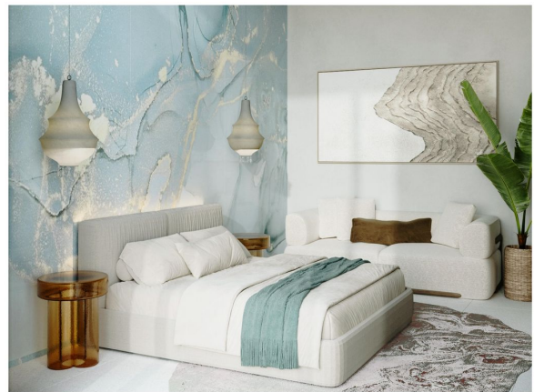
Bedroom of Villa 3 Bedrooms