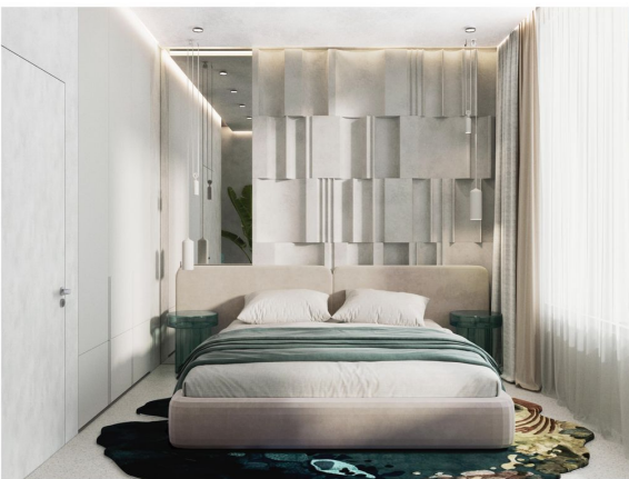
Bedroom of Town House