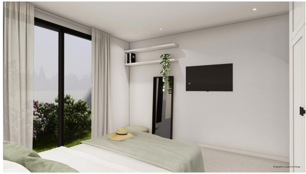
Infographics subject to change