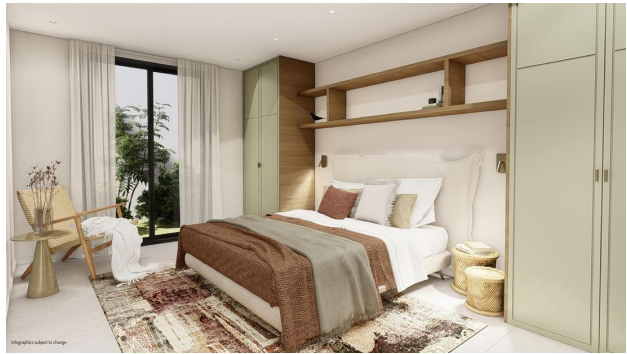
Infographics subject to change