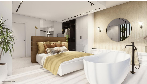
Infographics subject to change