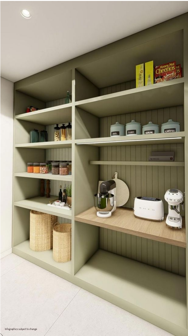
Infographics subject to change