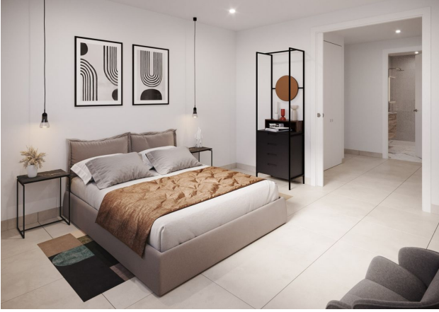
SANTA DOLA PLANTA BAJA / ESCALERA 2 VIVIENDA 3