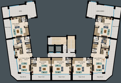
Bodrum Kat Planı