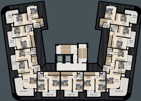
CATI KAT PLANI