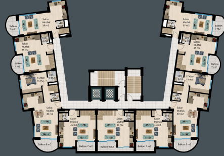
8. KAT PLANI