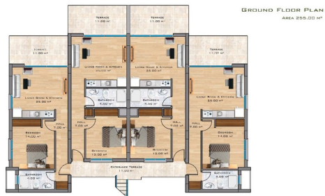
GROUND FLOOR PLAN AREA 255.00 M 2