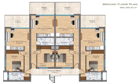
GROUND FLOOR PLAN AREA 255.00 M 2