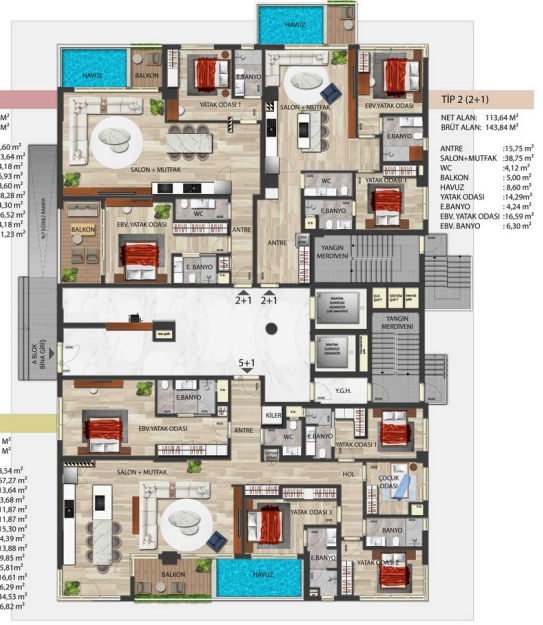
A BLOK ZEMİN KAT PLANI