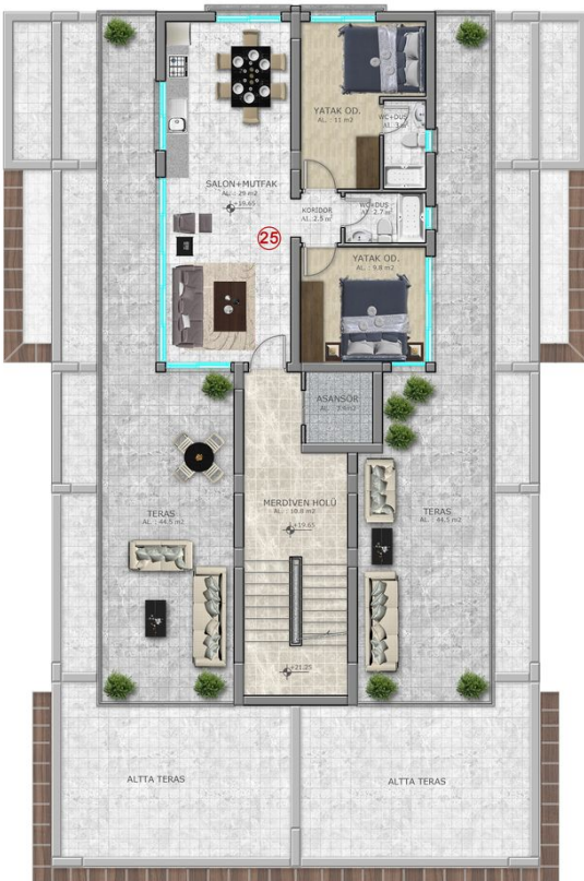
7. KAT PLANI