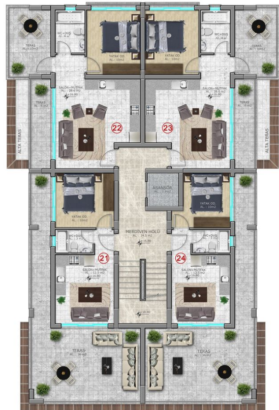
6. KAT PLANI