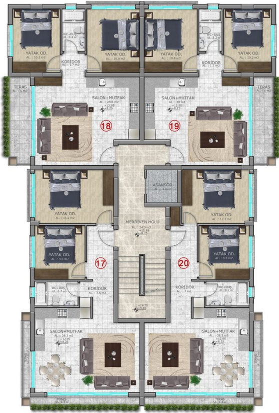
5. KAT PLANI