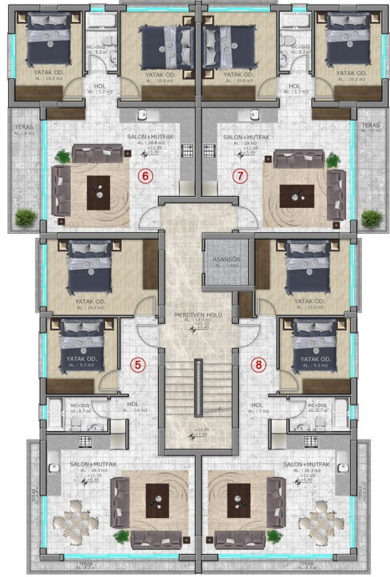
2. KAT PLANI