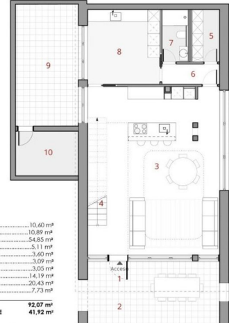
GROUND FLOOR HOUSE BUILT SURFACE 108.10 m 2 (TERRACES ARE NOT INCLUDED)

Ground Floor USABLE AREA 92.07 m 2 Ground Floor TERRACE SURFACE 41.92 m 2