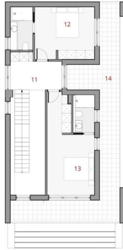
FIRST FLOOR HOUSE BUILT SURFACE 57.43 m 2 (TERRACES ARE NOT INCLUDED)

1st Floor USABLE AREA 51.07 m 2 1st Floor TERRACE SURFACE 32.72 m 2