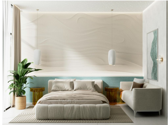
Bedroom of Small Apartment