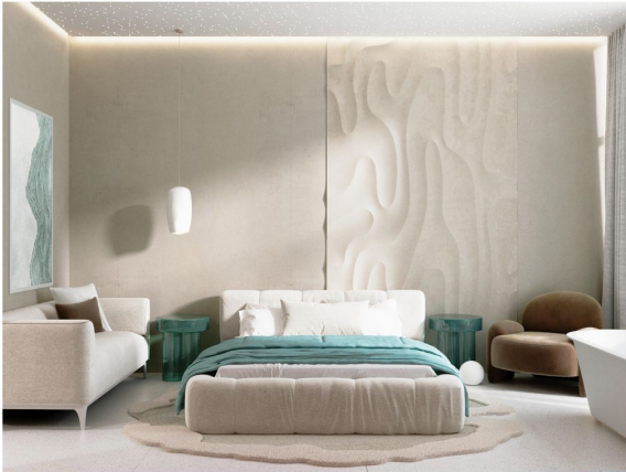
Bedroom of Big Apartment