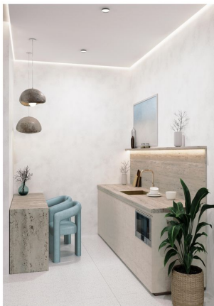
Kitchen & Dining Area of Big Apartment