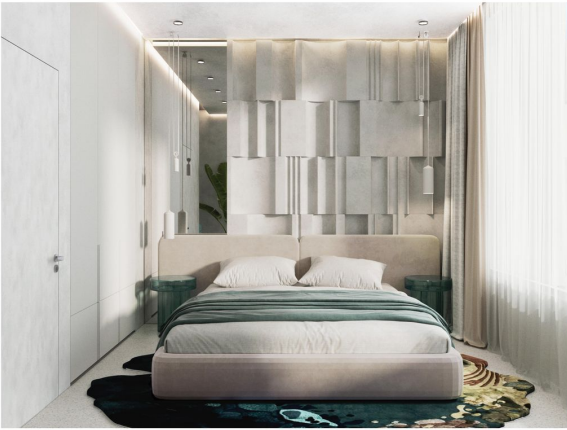
Bedroom of Town House